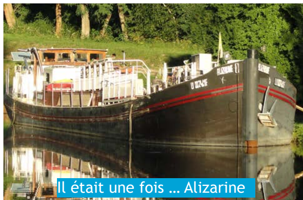
Il était une fois ... Alizarine

Un beau rêve auquel les aléas du monde économique a mis fin prématurément.